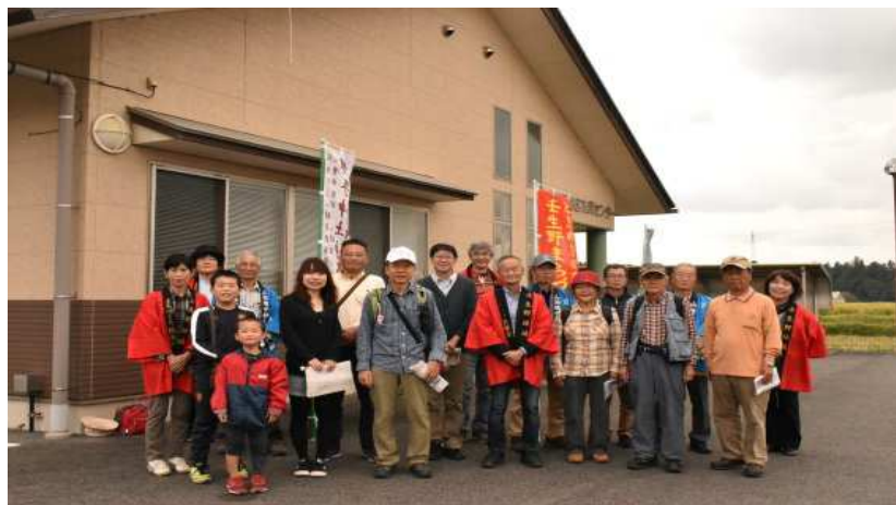
【壬生野地区市民センター】